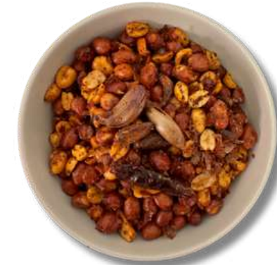
CACAHUATE ESPAÑOL CON AJO