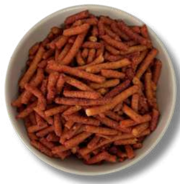
CHURRO AMARANTO / AJONJOLI CHILE