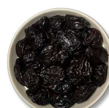
CIRUELA CON HUESO