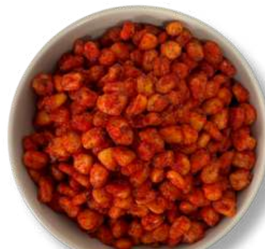
MAIZ POZOLERO ENCHILADO