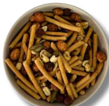
CHURRO MIX NAT (MEZCLA)