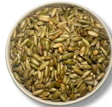
PEPITA VERDE FRITA