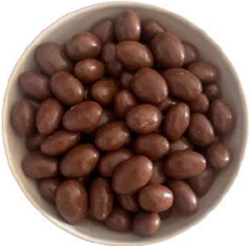
Almendra con chocolate