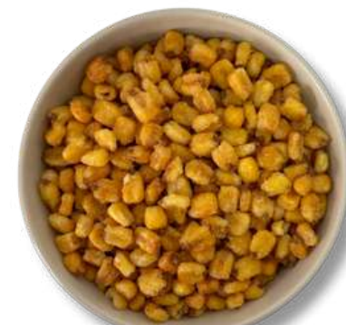
MAIZ POZOLERO SALADITO