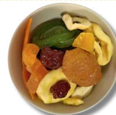
FRUTA MIX DESHIDRATADA (MEZCLA)