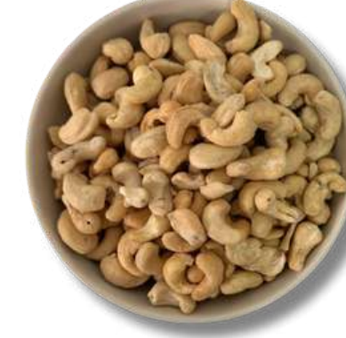
NUEZ DE LA INDIA HORNEADA SIN SAL