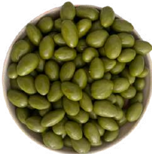
Almendra con Matcha