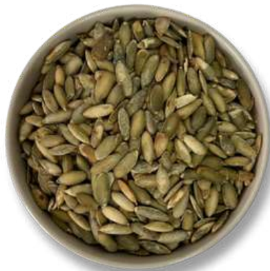
PEPITA VERDE HORNEADA