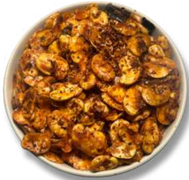
HABAS ENCHILADAS EN HOJUELAS