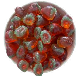
Goma Duranzo 3D