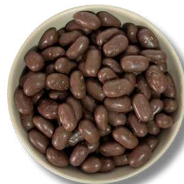
GALLETAS DE CHOCOLATE (SUSPIROS)