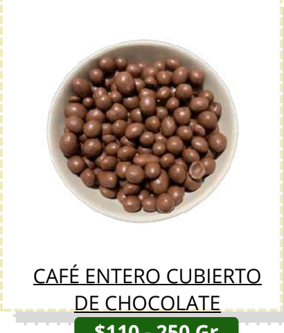
CAFÉ ENTERO CUBIERTO DE CHOCOLATE