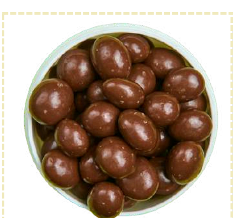
PASA CUBIERTA DE CHOCOLATE