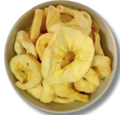
OREJON DE MANZANA DESHIDRATADA