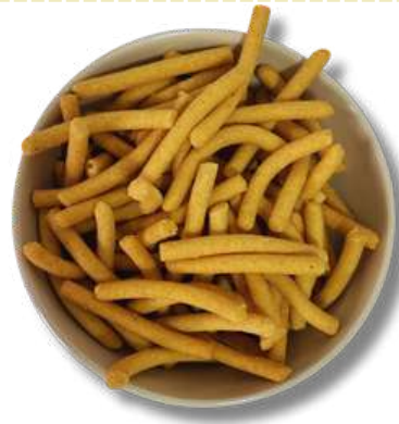
CHURRO AMARANTO / AJONJOLI NAT