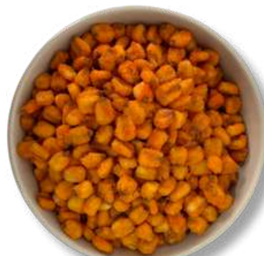
MAIZ POZOLERO CON QUESO CHEDAR