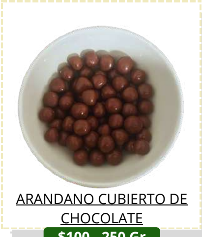
ARANDANO CUBIERTO DE CHOCOLATE