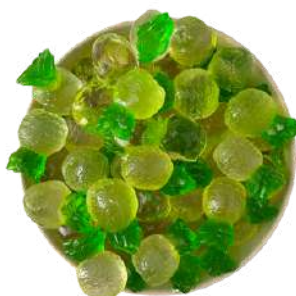
Goma de piña 3D