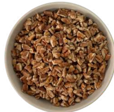
NUEZ EN PEDAZO