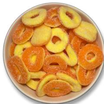
GOMA ARO DURAZNO