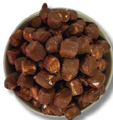
BOMBON DE CHOCOLATE