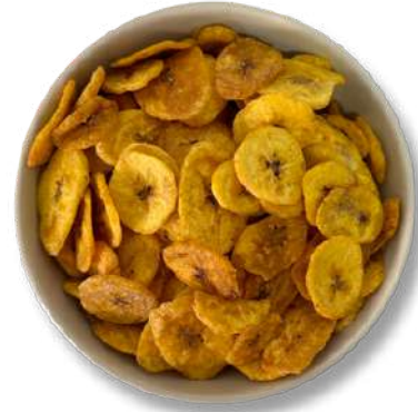
Platano Natural Horneado