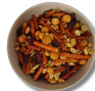
CHURRO MIX CHILE (MEZCLA)