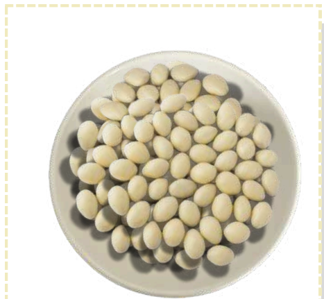
ALMENDRA CUBIERTA DE CHOCOLATE BLANCO