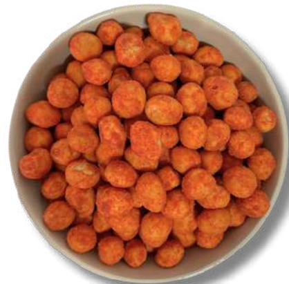
CACAHUATE JAPONES SABOR MANGO