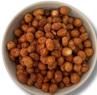
CACAHUATE HOLANDES (HOT NUT)