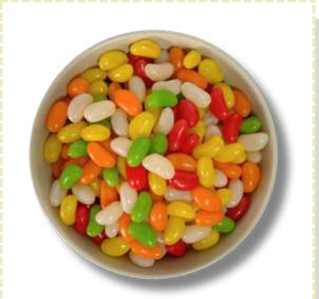
GOMA JELLY BEANS