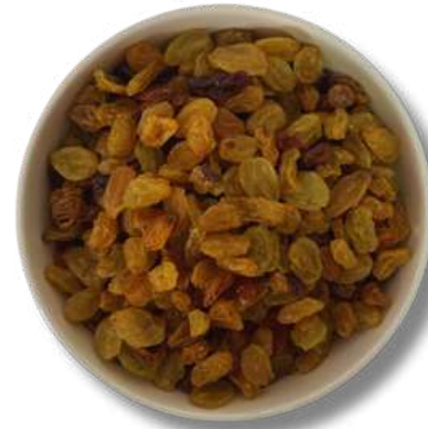
PASA RUBIA (DESHIDRATADA)