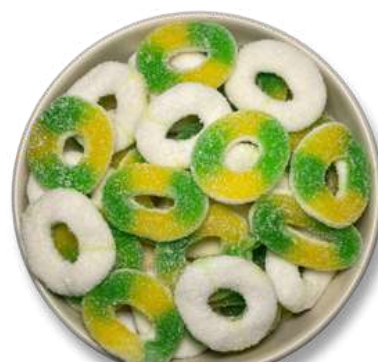
GOMA ARO MANZANA