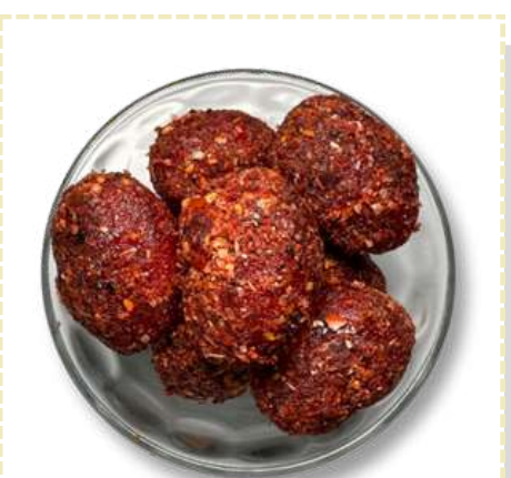
GOMA MANGOMITA / TAJIN