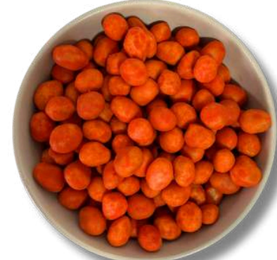
CACAHUATE JAPONES C/QUESO CHEDAR