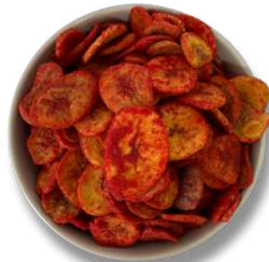
Platano Enchilado Horneado