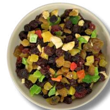
FRUTA MIX DESHIDRATADA (MEZCLA) CUBOS