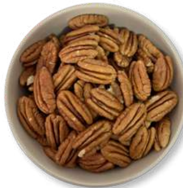
NUEZ EN MITADES