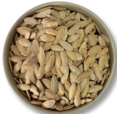
PEPITA CRIOLLA CON CASCARA