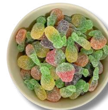
GOMA ACIDITA (FRUITAS)