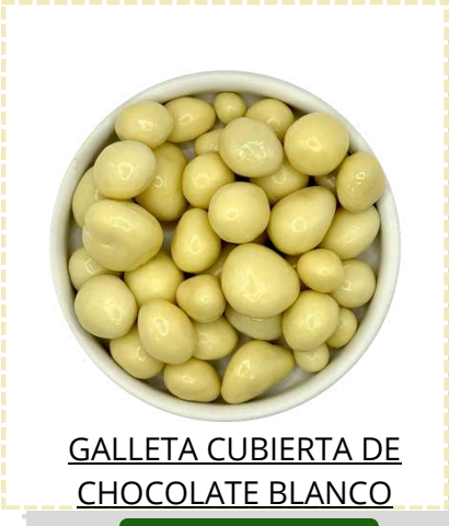
GALLETA CUBIERTA DE CHOCOLATE BLANCO