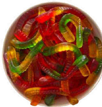
Goma de Lombriz