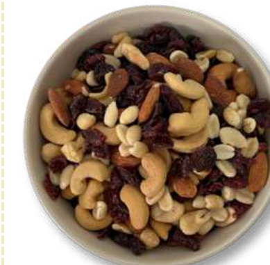
NUEZ MIXTA (MEZCLA DE NUECES)