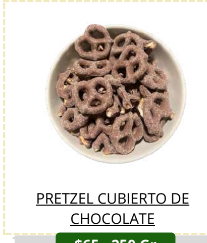
PRETZEL CUBIERTO DE CHOCOLATE