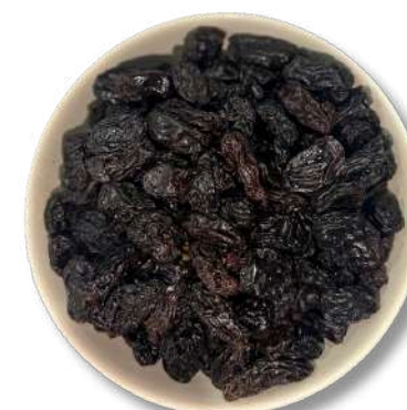
PASA NEGRA (JUMBO)