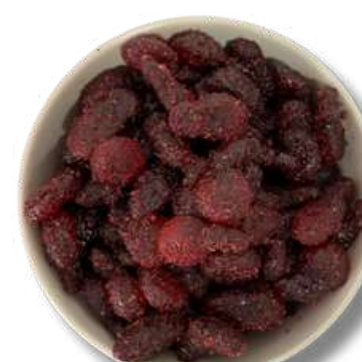
GOMA DE CHILE CON CHAMOY