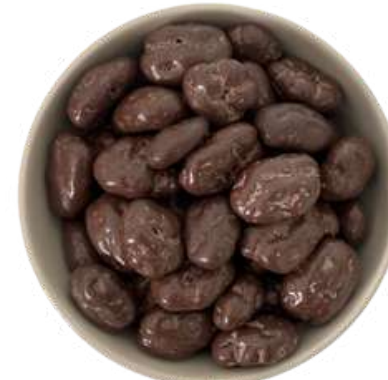
NUEZ CON CHOCOLATE