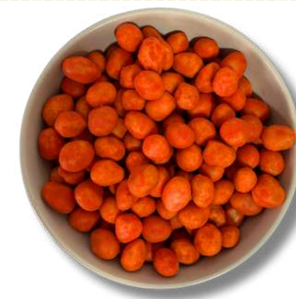
CACAHUATE HOLANDES SABOR ESQUITE