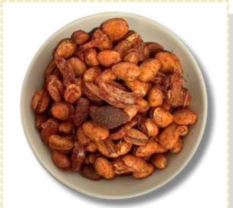
PISTACHE ENCHILADO O CON AJO