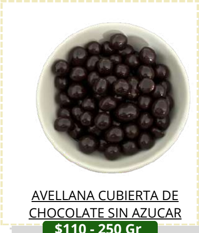
AVELLANA CUBIERTA DE CHOCOLATE SIN AZUCAR