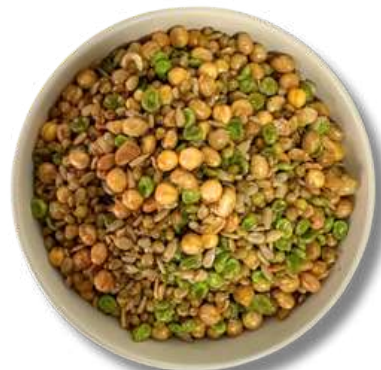
SOYA NATURAL C/ MEZCLA DE SEMILLAS