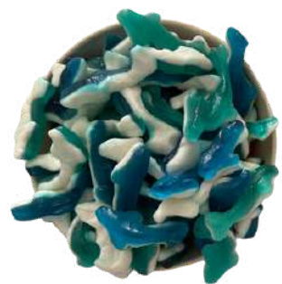
Goma de tiburón