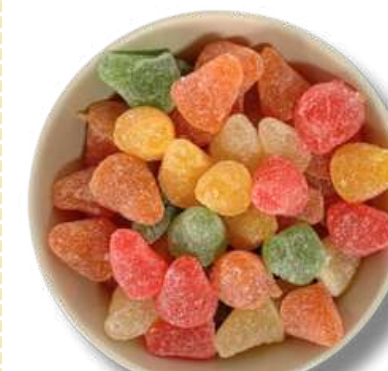
GOMA DE DULCE