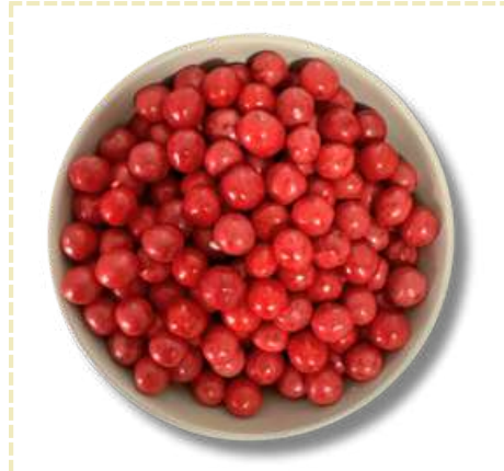
TAMACHU (BOLITAS DE TAMARINDO)