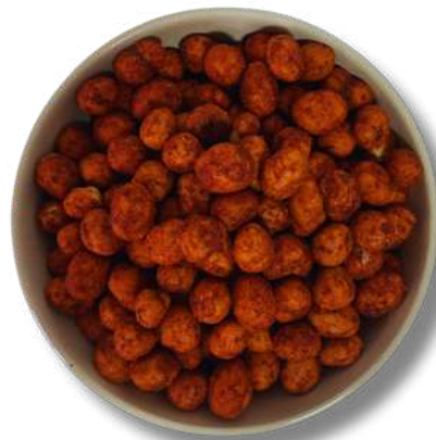
CACAHUATE JAPONES CON CHIPOTLE