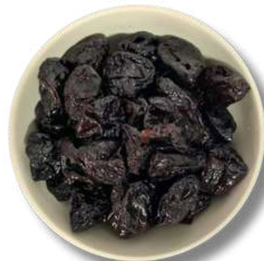
CIRUELA SIN HUESO