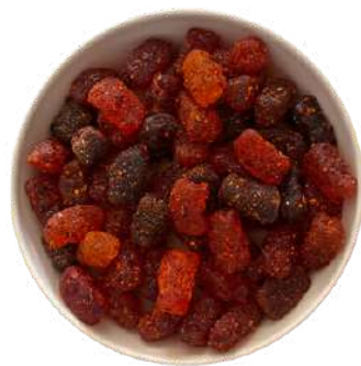
Goma de oso enchilado